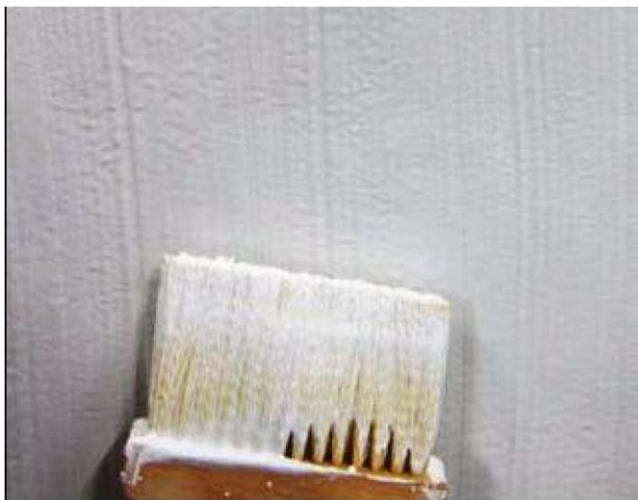
Также возможно механизированное нанесение

никакой свободной влаги не должно оставаться на поверхности перед нанесением.