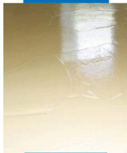
Свежая поверхность Mapefloor Decor 700 после нанесения шпателем