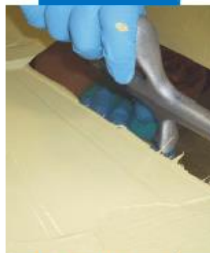
Нанесение Mapefloor Decor 700 с помощью гладкого шпателя