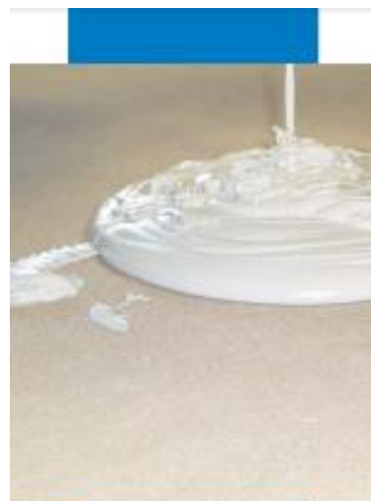
Mapefloor Decor 700 вылитый на основание сразу после замешивания

Наносите два слоя Mapefloor Decor 700 толщиной от 1,5 до 3 мм. Приготовьте продукт, вылив компонент А (2 кг) в компонент В (8 кг), добавьте Mapecolor Paste (0,7 кг на каждую упаковку Mapefloor Decor 700 ) и перемешайте их с помощью низкоскоростной дрели со спиральной насадкой до получения однородной пасты.