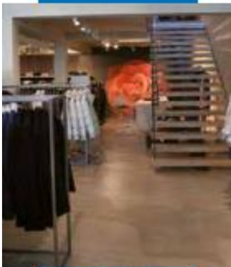
Полы выполненные из Mapefloor Decor 700