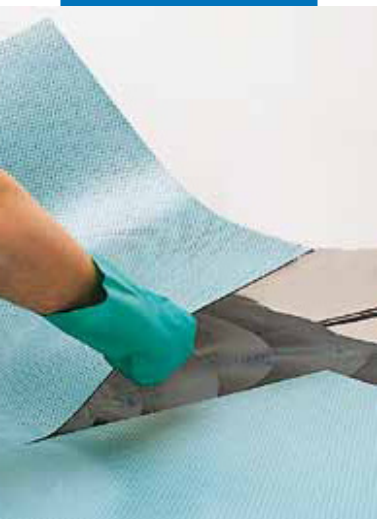
Laying conductive PVC tiles