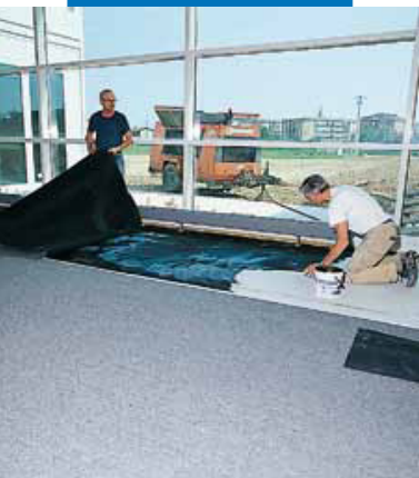
Installing industrial flooring in an electronics company